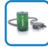
内置锂离子充电电池