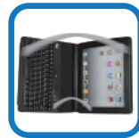
智能电源管理系统

艾迪索® Compagno™ 3 蓝牙铝合金皮套键盘专为新iPad® 设计，超薄铝合金材质及纤细优雅的外形，具有可分离式结构，携带方便。键盘采用蓝牙3.0无线技术和剪刀脚键帽，触感可以媲美笔记本电脑，击键声匀称细微。质感的皮套，耐磨防摔，并提供多视点角度，特别适合浏览和欣赏影视。独具匠心，皮套和键盘还可以独立使用和携带，若组合使用iPad功能将更加完美展现，拥有智能锁屏和磁控开关防误触的专利技术，更加节能环保。